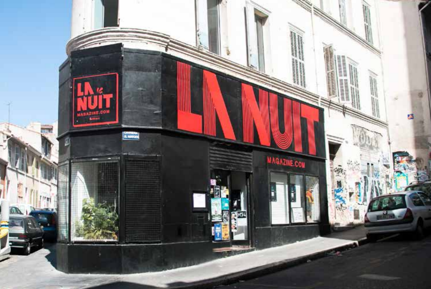
Les bureaux de La Nuit Magazine